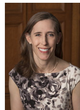
IHAROLD SHAPIRO ©